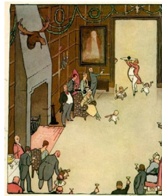
Het laatste steenkooltje wordt plechtig binnengedragen.

Laat de leerlingen een situatie uit de bovenstaande teksten of de opeisingen, voedselschaarste of voedselhulp in het algemeen verwerken tot een cartoon. Meer voorbeelden zijn te vinden op www.europeana14-18.eu/nl . Zoeken via cartoon of spotprent.