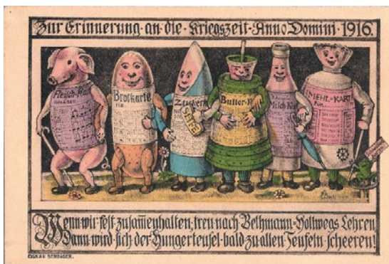
De voedselbonnen worden ludiek voorgesteld.