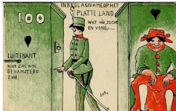
De opeisingen worden gehegeld.