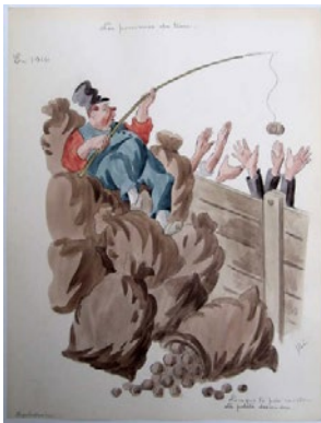
De boer, die zijn aardappelen maar mondjesmaat verkoopt, krijgt de volle lading.