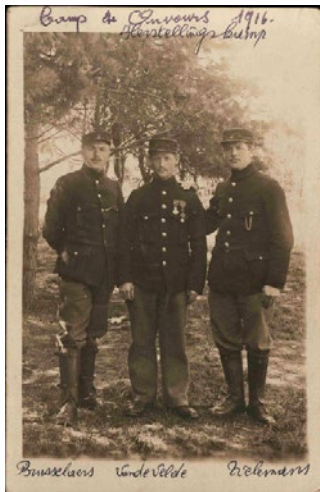
Postkaart met Aarschotse oorlogsvrijwilligers

Bespreek met de leerlingen of zij hun eigen geluk en/of comfortabele thuissituatie opzij zouden zetten om voor het vaderland of voor hun geloof te vechten? Kennen ze jongeren die die keuze hebben gemaakt? Of vinden ze in hun familie mannen die hun legerdienst weigerden toen dat nog verplicht was? Waarom?